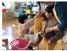
↑ 幼小学部の買い物学習

長かった 2 学期も振り返ればあっという間で、本日無事に終業式を迎えました。これも保護者の皆様や地域の皆様の温かいご支援のおかげと感謝申し上げます。